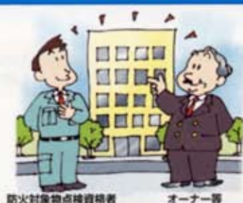
防火対象物点検資格者 オーナー等