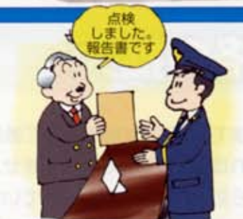
点検 しました。 報告書です。