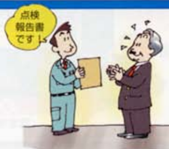
点検 報告書 です。

防火対象物点検資格者は防火管理上必要な業務等が基準に適合しているかどうかを点検し、その結果を報告書にまとめます。